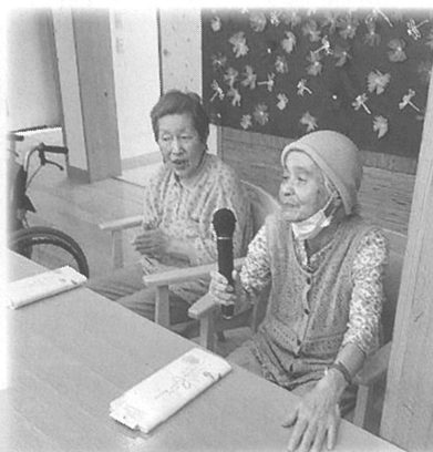
歌も楽しみました