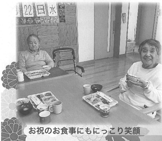
お祝のお食事にもにっこり笑顔