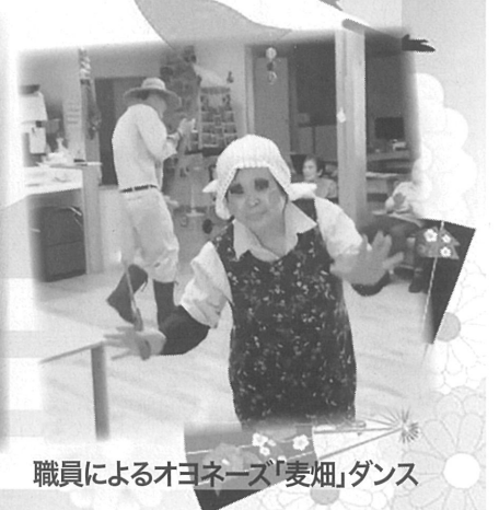
職員によるオヨネーズ「麦畑」ダンス