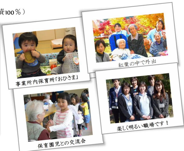
事業所内保育所「おひさま」