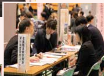
昨年度の相談の様子

ナースセンター職員による就業相談です。 「こんな時間帯で働きたい」 「離職期間があるけどどんなところで働けるだろう」etc. あなたにあった働き方を見つけてください。