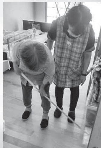
掃除の支援の様子

入居すると全部してもらえらると思われがちですが、食事以外の事は自分でする必要があります。一人では掃除などの家事をする事が難しい方にはヘルパーと一緒にいます。「掃除機はかけられないけれどモップがけはできる」「声かけをしてもらったら一緒にできる」など、できる家事を続けていける支援を心掛けています。