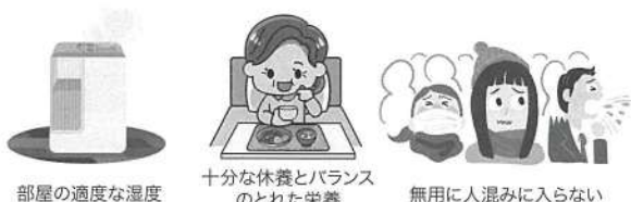
部屋の適度な湿度

インフルエンザは、主に、咳やくしゃみの際に口から発生する小さな水滴(飛沫)によって感染します(飛沫感染)。普段から“咳エチケット”(①他の人に向けて咳やくしゃみをしない、②咳やくしゃみが出るときはマスクをする、③手のひらで咳やくしゃみを受け止めたら手を洗うことなど)を心がけてください。