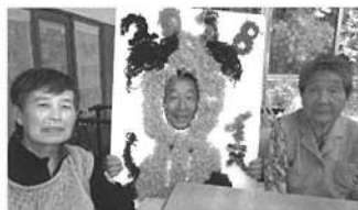
顔出しできます (※見本。中央は職員です)