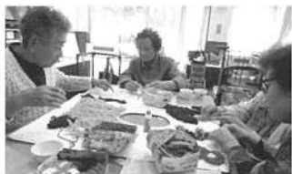
製作風景 (集中して取り組まれました)