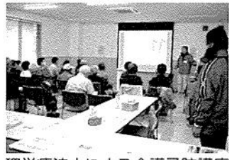
理学療法士による介護予防講座

11月11日介護の日フェアを開催しました。たくさんのご来場、ありがとうございました。